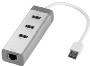
i-tec USB 3.0 Metal HUB 3 Port with Gigabit Ethernet Adapter P/N: U3GLAN3HUB