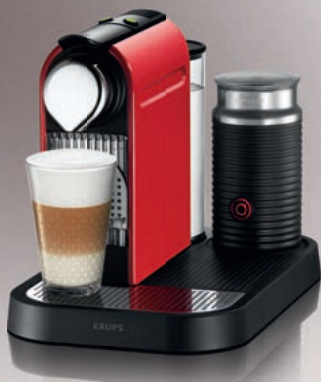
Nespresso Krups CitiZ&milk XN730S

Díky ucelené řadě kávovarů CitiZ si připravíte kávu tak, jak ji máte rádi. Jsou vybaveny odbornými znalostmi Nespresso ve formě intuitivního a komfortního ovládání.