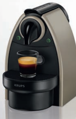
Nespresso – Krups Essenza XN2140

Kávovar Essenza je kombinací kompaktního designu a mimořádně jednoduchého ovládání. Z každého šálku kávy se tak stává umělecké dílo.