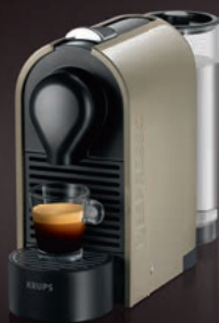
Nespresso Krups U XN250A

Nový automatický kávovar. Svou kávu si snadno připravíte pouhým pohybem posuvníku. Stačí jen vložit vaši oblíbenou kapsli a připravit šálek. Zavřením posuvníku spustíte automatickou přípravu vaší kávy preferovaného objemu. U se díky svým čistým liniím a důmyslnému designu přizpůsobí každému interiéru.