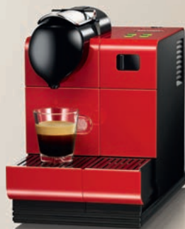
Nespresso De'Longhi Lattissima EN520.R