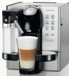
Nespresso De'Longhi Lattissima EN720.M (1)

Kávovar Lattissima byl vytvořen především pro ty, kdo milují kávu s čerstvým mlékem. Připravte si espresso, lungo, cappuccino nebo latte macchiato pouhým stiskem tlačítka.