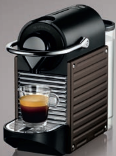
Nespresso Krups Pixie XN3008

Společnost Nespresso podporuje recyklaci kapslí využívající možnost opětovného použití hliníku. Tento závazek se nyní zhmotnil v panelech kávovarů PIXIE barvy Carmine a Brown, které jsou minimálně z 98 % vyrobeny z recyklovaných Nespresso kapslí.