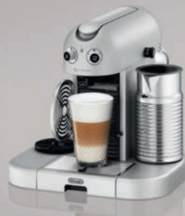
Nespresso – De'Longhi Gran Maestria EN470.SAE

Celohliníkové tělo – Aeroccino4 se čtyřmi možnostmi přípravy mléčných receptur Automatické nahřívání šálek – Otočná podložka šálku pro vysokou sklenici – Ovladač velikosti šálku Signalizace potřeby odvápnění – Programovatelné funkce – Kontejner na 10–14 použitých kapslí Nádoba na vodu: 1,4 l – Funkce automatického vypnutí po 9 min (programovatelná na 30 min) Rozměry: 32 x 30 x 38 cm (šxvxh)