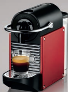
Nespresso De'Longhi Pixie EN125.R