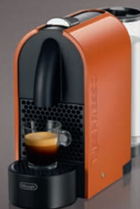
Nespresso De'Longhi U EN110.O