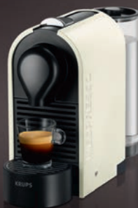
Nespresso Krups U XN250A