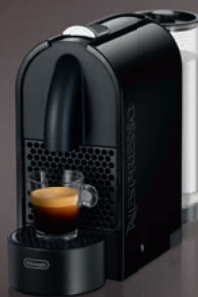
Nespresso De'Longhi U EN110.B