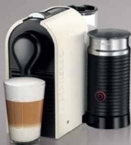
Nespresso Krups UMilk XN2601

Kávovar U s integrovaným šlehačem mléka Aeroccino je ideální k přípravě celé řady teplých i studených variací kávy s mlékem. Svou kávu si snadno připravíte pouhým pohybem posuvníku. Stačí jen vložit vaši oblíbenou kapsli a připravit šálek. Zavřením posuvníku spustíte automatickou přípravu vaší kávy preferovaného objemu. Díky Aeroccinu , s nepřilnavým povrchem, pohodlně vykouzlíte jemnou a hustou mléčnou pěnu.