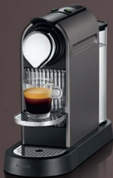
Nespresso Krups XN720T

Kávovary koncipované tak, aby uspokojily jak milovníky kávy Nespresso , tak obdivovatele moderního designu. CitiZ představují harmonii vysoce moderní technologie a inspirace retro designem.