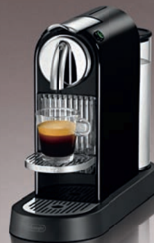
Nespresso De'Longhi EN166.B