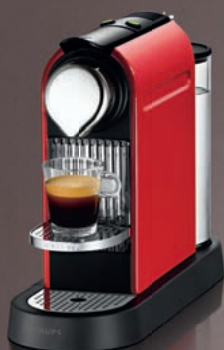
Nespresso Krups XN720S