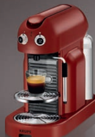
Nespresso –Krups Maestria XN8006

* Spotřeba energie v souladu se standardy měření FEA, verze 7.2, datovaná 20090511. Tento kávovar spadá do řady přístrojů se spotřebou energie o 40 % nižší než kávovary řady A.