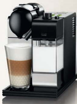
Nespresso De'Longhi Lattissima EN520.S

Nová generace kávovarů Lattissima s nejmodernější technologií přináší ještě jednodušší a intuitivnější ovládání. Jediné cappuccino nebo latte macchiato připravíte jediným stiskem tlačítka.