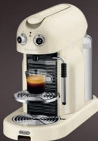
Nespresso – De'Longhi Maestria EN450.CW

Maestria , kávovar podle vašich představ. Zdokonalená parní tryska umožňuje přípravu mléčné pěny jako od skutečného baristy.