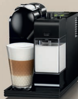
Nespresso De'Longhi Lattissima EN520.B