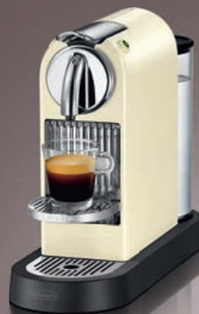
Nespresso De'Longhi EN166.CW