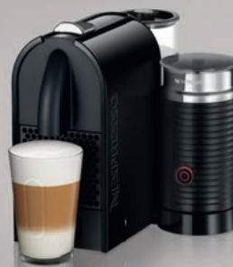
Nespresso De'Longhi UMilk EN210.BAE