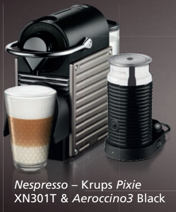
Nespresso – Krups Pixie XN301T & Aeroccino3 Black

Chcete-li využít nejmodernější technologie k přípravě lahodných receptur kávy s mlékem, pak vám navrhujeme kombinaci kávovaru Pixie s přístrojem na přípravu mléčné pěny Aeroccino3.