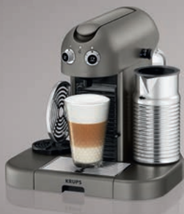
Nespresso – Krups Gran Maestria XN8105

Gran Maestria . Maximálně luxusní kávovar vybavený nadstandardními prvky jako nahřívač šálek a přístrojem na přípravu mléčné pěny Aeroccino4 .