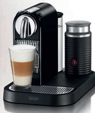
Nespresso De'Longhi CitiZ&milk EN266.BAE