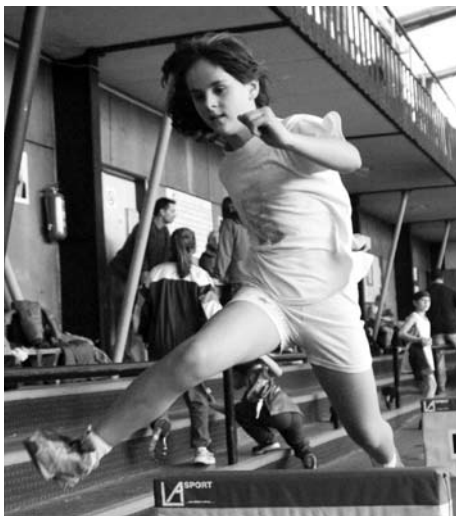
Kinderiáda – z průběhu oblastního kola

Pro první stupeň základních škol je určena Kinderiáda . Jedná se o soutěž osmičlenných družstev složených z chlapců a dívek 2.–5. ročníků (vždy jeden chlapec a jedna dívka z každého ročníku). Každý ročník má své dvě soutěžní disciplíny a na závěr se běží štafeta. Kromě toho však je v průběhu konání akce na hřišti celá řada nesoutěžních činností, které mají zábavnou formou děti seznámit s různými atletickými disciplínami. Český atletický svaz ve spolupráci s agenturou najímanou sponzorem projektu zajišťuje uspořádání osmi oblastních kol a národního finále. Zde je vždy zajištěn doprovodný nesoutěžní program s využitím dětského atletického náradí a programu Kid`s athletics, jehož garantem je Mezinárodní atletická federace (IAAF). Toto náčiní je dostupné pro všechny zájemce ze škol. První tři družstva z národního finále pak pro svou školu získají nemalé finanční prostředky na nákup sportovních pomůcek či vylepšení školních sportovišť. Je samozřejmé, že těchto kol se účastní