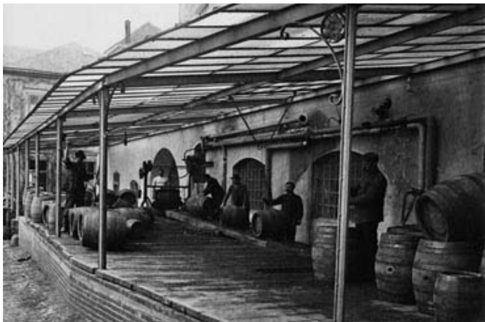
Rampa pro nakládání sudů v Pivovaru Klášter v roce 1906