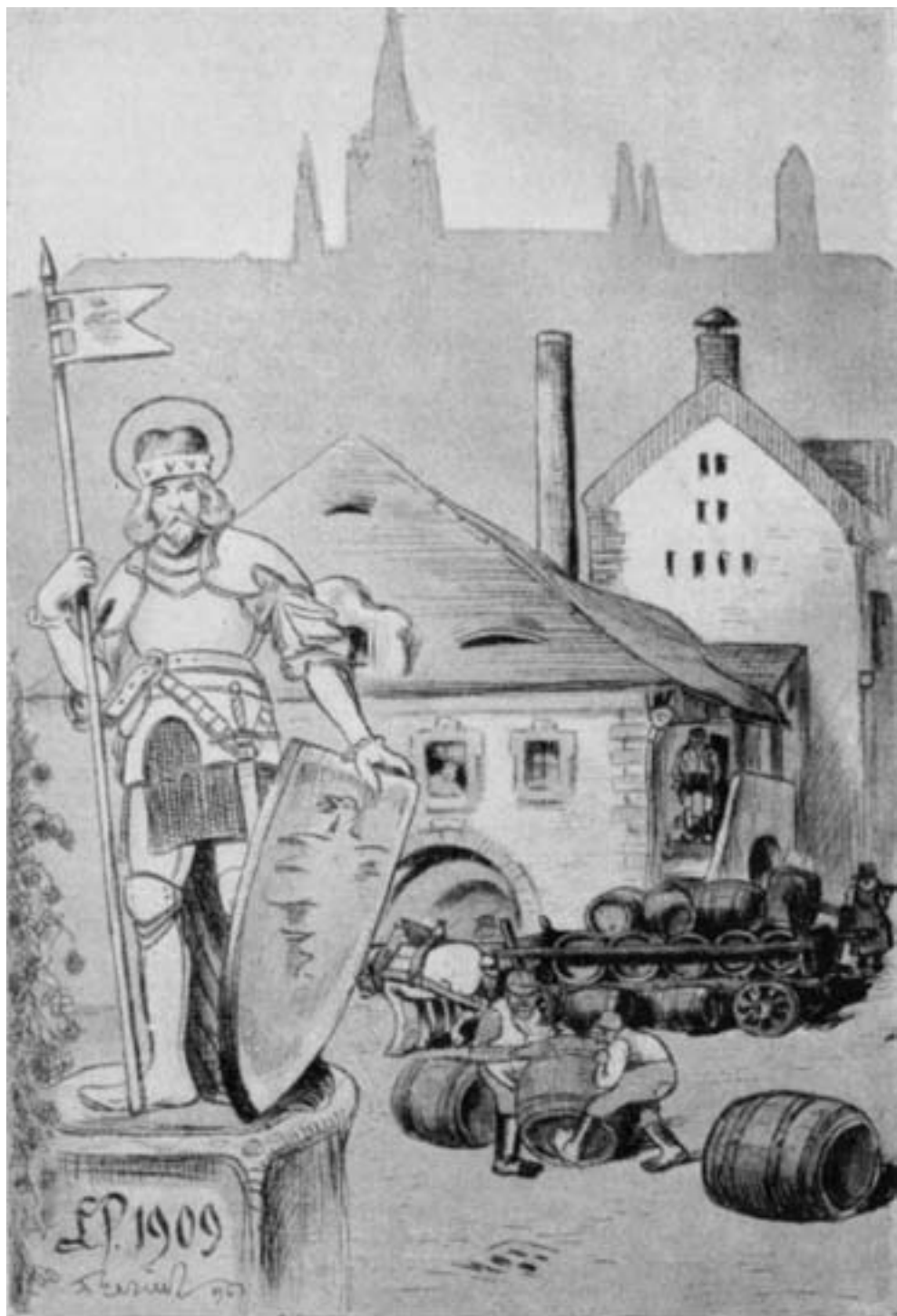
Svatý Václav jako patron českého piva a farmářský vůz naložený sudy na historické ilustraci