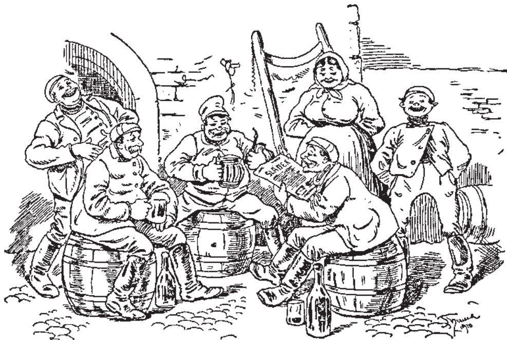
Ilustrace K. L. Thůmy pro časopis Sládek z roku 1907

O udržování pořádku ve všem všudy staral se „ mistr pivovarský “. Vedle práce sladovnické, o kterou měli pečovati a k ní dohlížeti (sypání a kropení sladu, mytí koryt, kádí, štípání a tlučení dříví apod.) „předně a nejprve mistři pivovarští v pivovářích při svých pracech v pobožnosti a v cnosti živi býti, k tomu řečí vopzlých, kteréž by proti Pánu Buohu i také dobrejm lidem a vzláště když ženské pohlaví do pivováru pro mláto chodí, zanechati mají. Mistr pak maje pomahače, tolikéž ho k tomu, aby dobře na světě živ byl, vésti a napomínat má.“