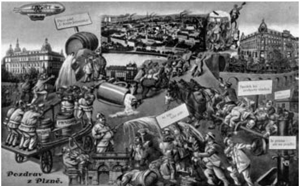
Historické pohlednice města Plzně s pivní tematikou ( www.historicke-foto.cz )