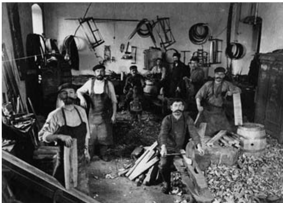
Bednáři Pivovaru Klášter v roce 1906