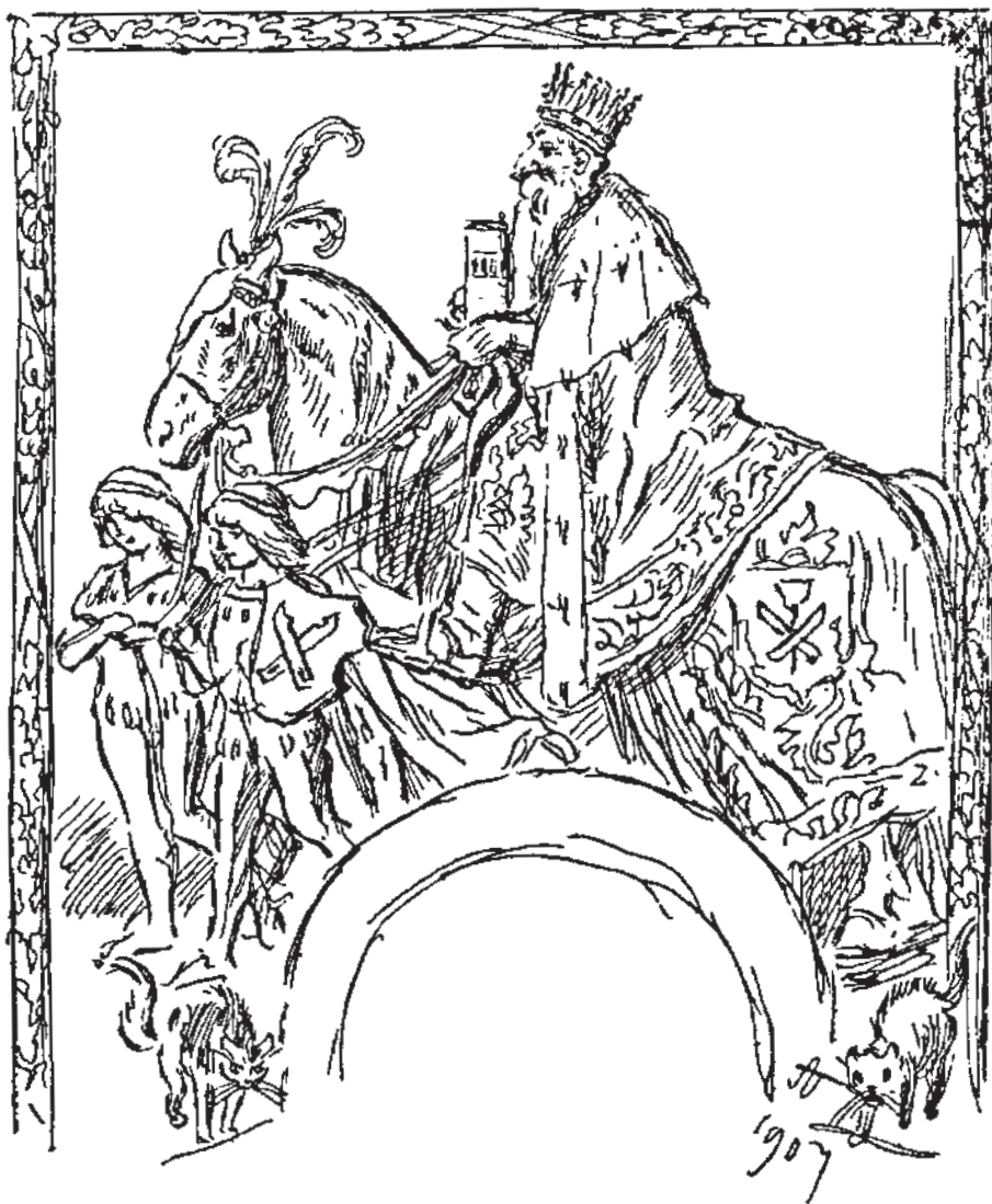
Ilustrace Mikoláše Alše z roku 1907, otištěná v časopise Sládek

„Ferdinand z Boží Milosti římský, uherský, český etc. král, infant v Hispanii, arcikníže rakouské a markrabě moravské etc. Opatrní, věrní naši milí! Věděti Vám dáváme, že k truňku císaře římského, Jeho Milosti pana bratra našeho nejmilejšího a dětí našich nejmilejších piva potřebovati ráčíme. I majíce My vědomost, že Vy piva