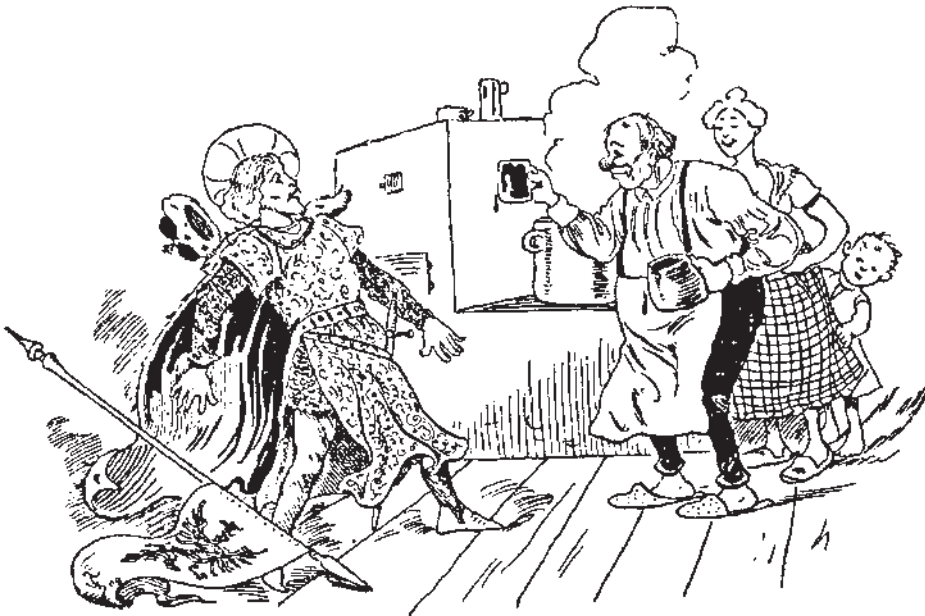
Sv. Václav, patron českých sládků, okouší na svůj svátek doma vařené „takypivo“.

Že pivo zhusta tenkrátě bývalo falšováno, svědčí také zvláštní církevní zápo- věď, které se laskavý čtoucí asi nemálo podiví. Mezi velikými hříšniky, kdož nebyli připuštěni ke stolu Páně, ke sv. přijímání, zapsáni v seznamu rukopisném v univer- sitní knihovně pražské, ze století XV., vedle jiných provinilců ti – kdož pivo falšují!