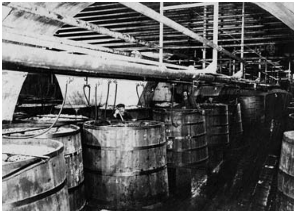
Spilka, kvasní kádě v Pivovaru Klášter, historická fotografie z období 1966–1913