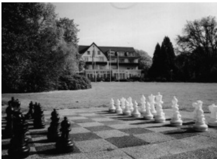
Šach starým pořádkům: Hotel De Bilderberg – výchozí bod bilderbergského spiknutí

hlubší smysl takového zařízení? Vlastně ani ne, a tak jsem se rozhodl, jdouce pomalu nahoru úzkou silnicí k odlehlému hotelovému komplexu, že ředitelství dám ve věci marketingu takový malý tip. Tento plán však okamžitě padl, jakmile jsem zahlédl plné parkoviště. Husté řady holandských aut s nosiči kol na zádi. Hotel De Bilderberg je dnes vysoce oblíbený výletní hotel turistů, kteří pěstují v regionu cykloturistiku. Samotný hotel je protažený, dvoupodlažní komplex s obytným podkrovím a dvěma charakteristickými štíty, zasazenými v pravém úhlu k podélné ose budovy.