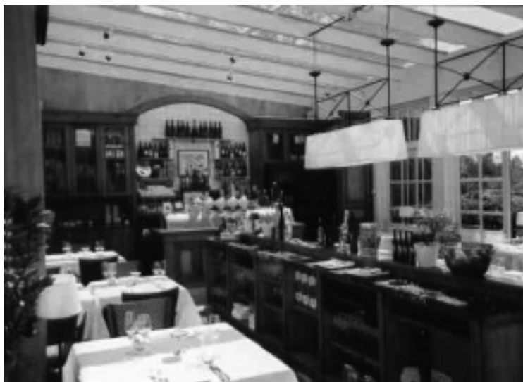
Zimní zahrada v hotelu De Bilderberg

zlepšení napjatých vztahů mezi Evropou a Amerikou. Toto setkání nebylo veřejné. (...) Iniciátorem konference byl Polák dr. Józef H. Retinger, jenž cestoval hodně po Evropě a znal se se všemi důležitými osobami západní Evropy. Kromě jiného zahájil spolupráci s princem Bernhardem, účastníkem první konference. Princ Bernhard se později stal stálým předsedou; tuto funkci zastával až do roku 1976. Úspěch první konference byl tak veliký, že se organizátoři rozhodli v konferencích pokračovat.“