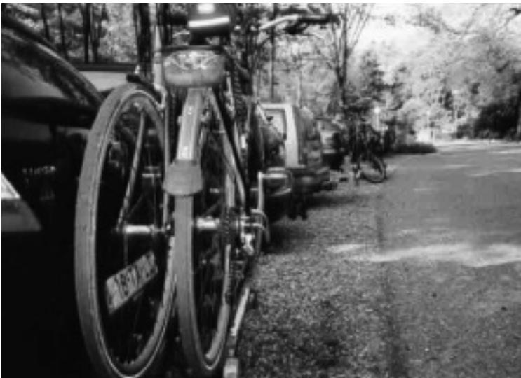
Parkoviště pro hosty