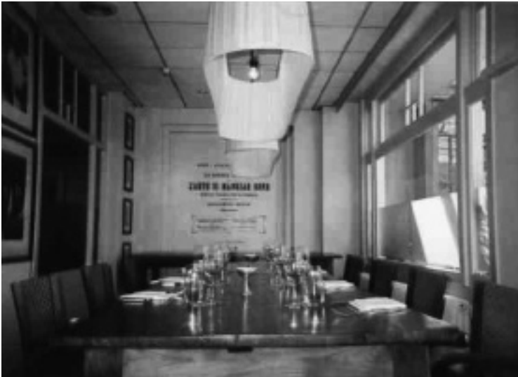
Starý konferenční stůl v hotelu De Bilderberg

nili vojenskou centrálu na návrší v Utrechtseweg v civilní komplex. U dlouhého konferenčního stolu z ušlechtilého dřeva jako by ještě dnes seděli koncernoví bossové z dob hospodářského zázraku, zatímco v prosvětlené zimní zahradě s pompézním barem, připomínajícím Kubrickovo Shining, dost možná konverzovaly rozverné dámy.