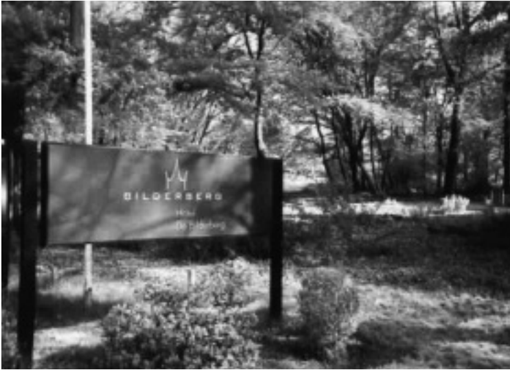
Hotelová tabule na okraji cesty