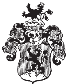
Erb pánů ze Žerotína