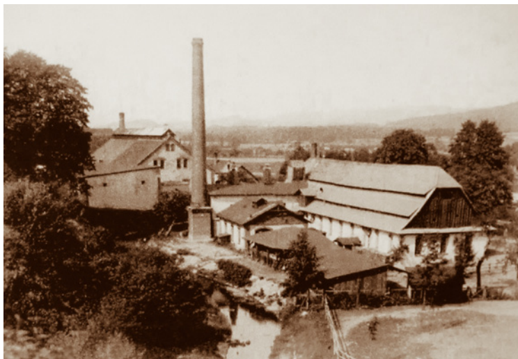
Dobová fotografie – vpředu rožnovská papírna, na pozadí rožnovský pivovar.

Město Rožnov pod Radhoštěm i přilehlý region v roce 1949 významným způsobem ovlivnilo založení národního podniku Tesla na výrobu elektronických součástek. Tesla měla zásadní význam pro rozvoj města i celého mikroregionu. Znamenala povznesení životní úrovně obyvatel, především po stránce sociální, ale také co se vzdělanosti týká, nevyjímaje kulturu a sport. Tesla se stala rozhodujícím hnacím momentem v celospolečenském kontextu. Národní podnik Tesla Rožnov ovlivnil životy tisíců lidí, stal se celoživotním osudem několika generací. Po roce 1990 Tesla zanikla a v rozsáhlém průmyslovém areálu vzniklo několik desítek privátních firem.