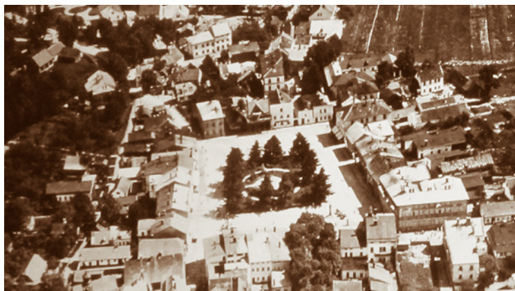
Letecký pohled na Rožnov z roku 1923.

Také samotné město se během posledních let změnilo. Byly renovovány významné budovy a vznikly nové objekty obchodních i podnikatelských organizací. Město disponuje zázemím dobře vybudovaných sportovišť, má dostatečnou ubytovací kapacitu, také nabízí hodnotné kulturní pořady. Rožnov se téměř neustále mění, je to město moderní, přívětivé a přitažlivé pro každého návštěvníka.