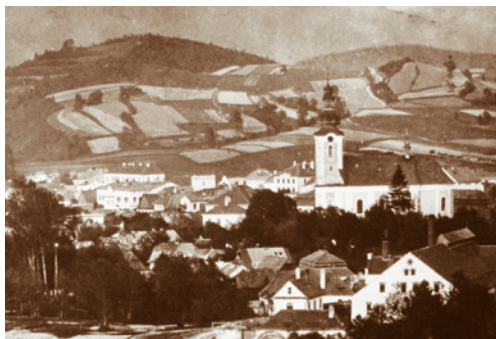
Rožnov v první polovině 20. století.

stará zástavba červených střech, mile stulených v záplavě zeleně kolem náměstí a kontrastující typická architektura druhé poloviny 20. století panelovými domy a rozsáhlou průmyslovou zástavbou. V některých městských částech lze podnes spatřit původní „dřevěnky“ – dřevěné domy z 19. století. Tak se ve městě podnes snoubí hřejivá minulost s účelovou, ale poněkud chladnou současností.