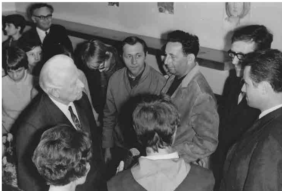
President Ludvík Svoboda mezi spisovateli na Sjezdu mladých čtenářů