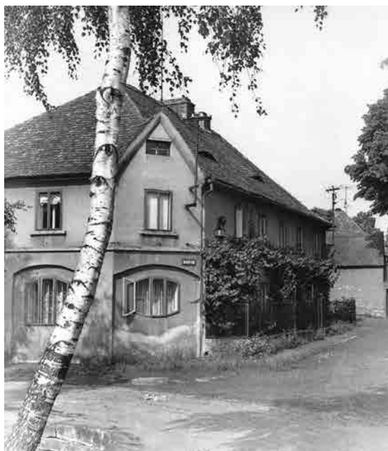
Rodný dům Konstantina Biebla ve Slavětíně