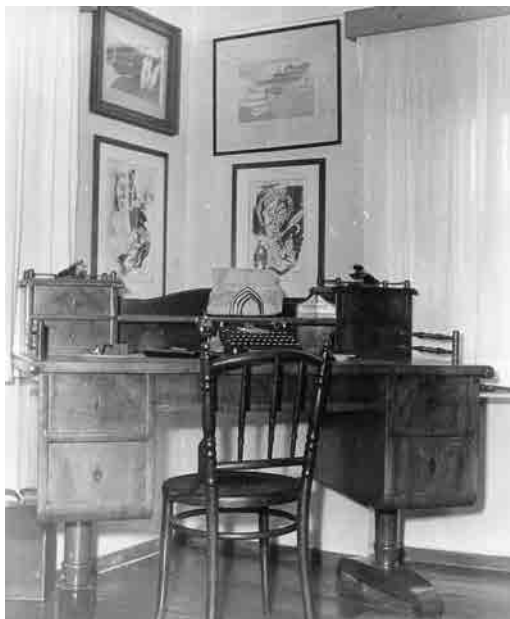
Záběr z pracovny Konstantina Biebla ve Slavětíně

Děkuji Ti za Tvou gratulaci k příštímu roku,