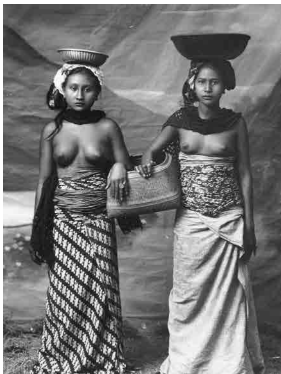
Ženy z ostrova Bali

Pak napíšeš holandsky nebo německy, co chceš pít nebo mít a na konci cesty se to najednou zaplatí. Hotovými penězi se skoro nikde na holandských lodích neplatí, všechno jde na bon.