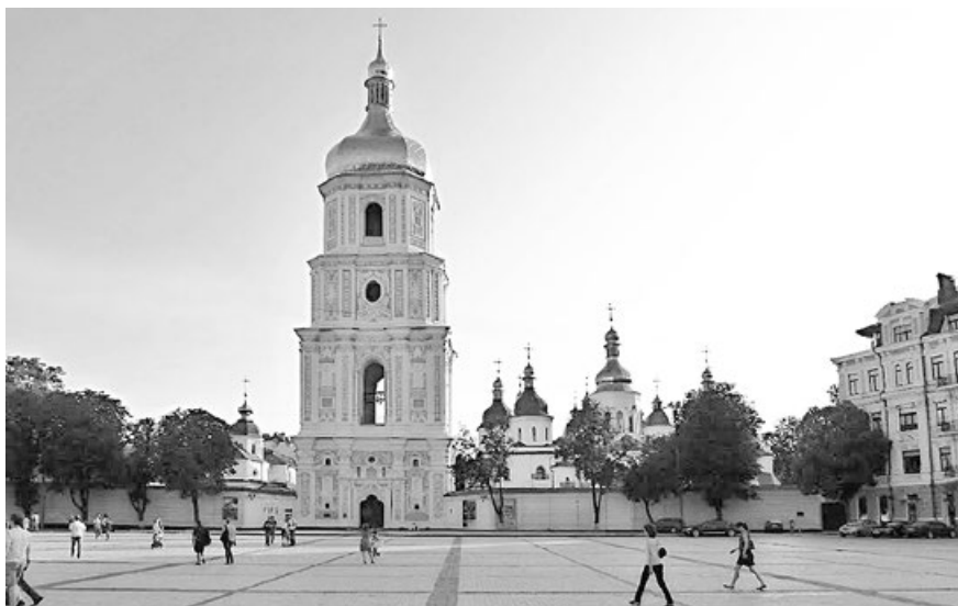
Na chodníku před zvonící Sofijského chrámu byl v roce 1995 pochován patriarcha ukrajinské pravoslavné církve Volodymyr, dovnitř nesměl. Pohřeb provázely potyčky tisíců demonstrantů s policií.

Pro ruské historiky (a to i pro sovětské) je typické dokazovat na příkladu Kyjevské Rusi, že vždy existovala jen Rus, z níž se odvíjely různé národnostní větve, jazykové dialekty, ale jejich základem byla vždy