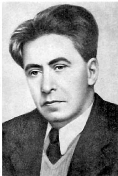
Mistr pera Ilja Erenburg.

řadu let v Paříži, kde se rovněž seznámil s V. I. Leninem. Meziválečné Československo popsal roku 1931 jako zemi, kde „milují amerikanismus a knedlíky se zelím a vyvážejí do světa Čapkovy spisy a Baťovy výrobky. To druhé svět potřebuje, to první si mohou nechat, vždyť každá země má Čapků dost.“