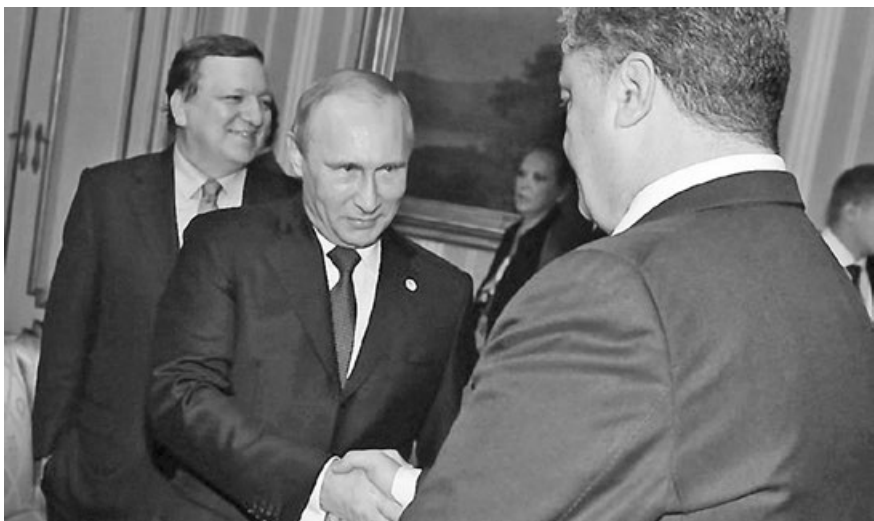
Stisky rukou a lišácký úsměv: Vladimír Putin a Petro Porošenko v Minsku.