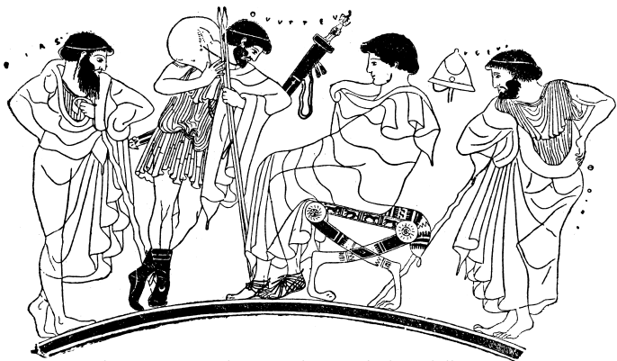
Odysseus opřený o kopí přemlouvá sedícího Achillea, aby pokračoval v boji. Za Odyssem stojí Aias, za Achilleem Foinix.

řečnictví a ovládání zbraní. Vychováván byl také u moudrého kentaura Cheiróna (živil ho jenom vnitřnostmi lvů a kanců), kde se rovněž vyučil lékařství.