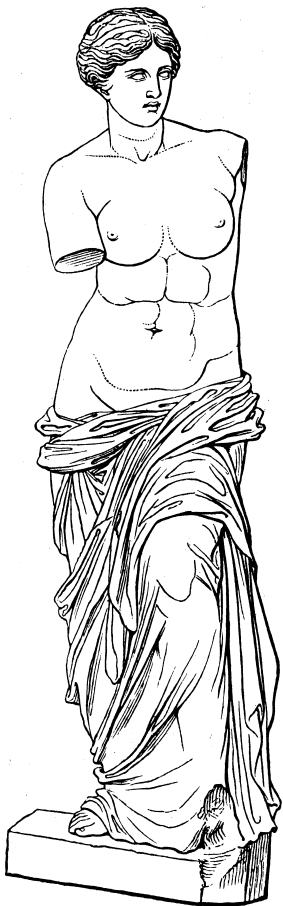
Socha Afrodity z Mélu

Afrodité (2. p. Afrodity) – řecká bohyně smyslné lásky, krásy a plodnosti. Jedna z dvanácti velkých olympských bohů. Ztělesňuje tvořivou milostnou touhu, která si podmaňuje všechny tvory: zvířata, lidi i bohy. Také zúrodňuje pole, účastní se porodů a je ochránkyní domácí hojnosti.