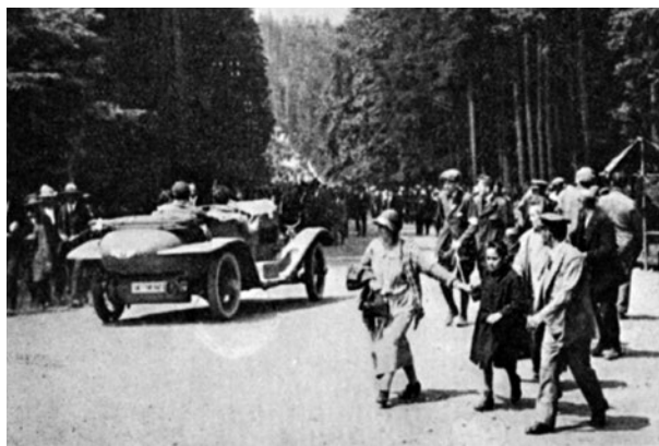
Nadšené a početné davy odcházejí po závodě domů