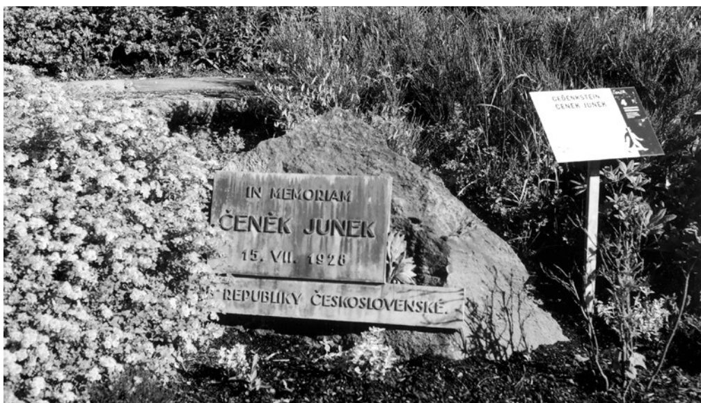
V areálu německého okruhu Nürburgring stojí trvalá vzpomínka na velkého českého závodníka