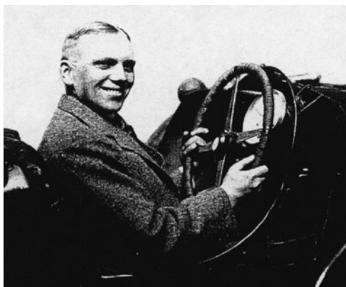
Známy a úspěšný závodník za volantem vozu