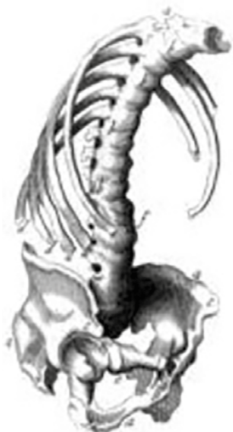
Obr. 1 Kostra nemocného s ankylozující spondylitidou podle Bernarda Connora z roku 1693 (Pugh, 2002)

První popis této nemoci se objevil v literatuře v roce 1559, kdy Realdo Colombo zveřejnil anatomický popis dvou koster s abnormalitami typickými pro toto onemocnění. O více než 100 let později, v roce 1693, irský student medicíny Bernard Connor objevil a nakreslil kostru zemřelého francouzského farmáře, u něhož charakterizoval a popsal patologické změny v oblasti pánve, páteře a žeber: „Kosti byly v kloubech napřímené a jejich vazy zkostnatělé a jednotlivé klouby na páteři tvořily jednu souvislou kost“ (obr. 1).