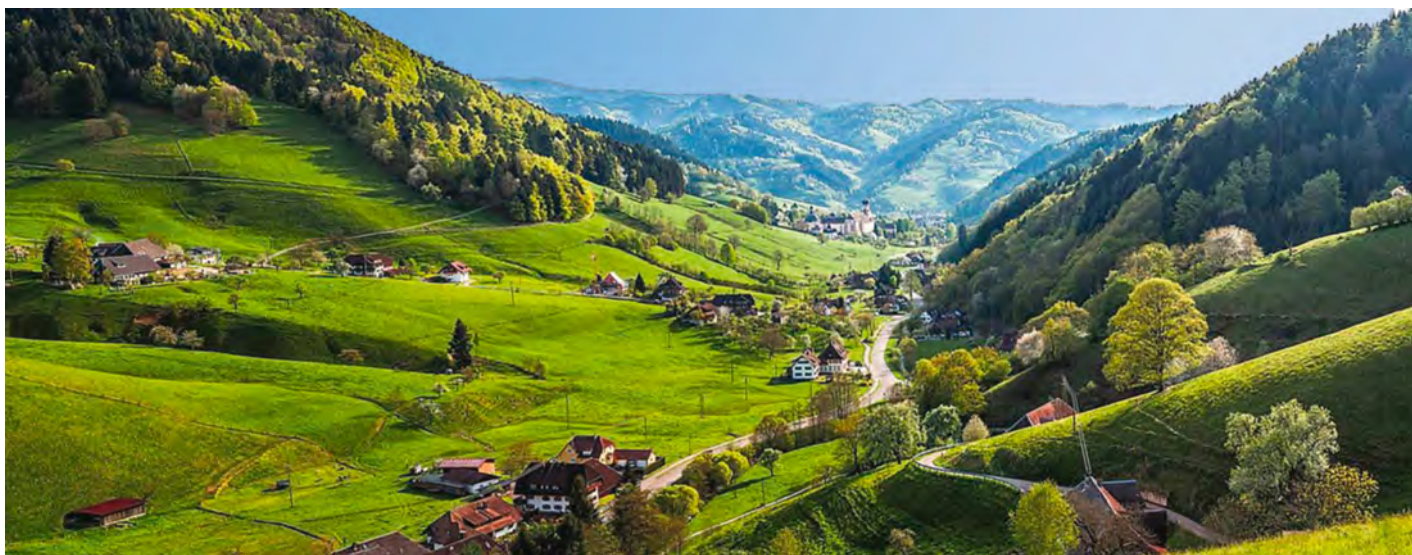
Krajina v okolí hornobavorského městečka Bad Feilnbach v alpském podhůří na řece Inn, kde na statku Guggenhof Kryštof Dientzenhofer vyrůstal