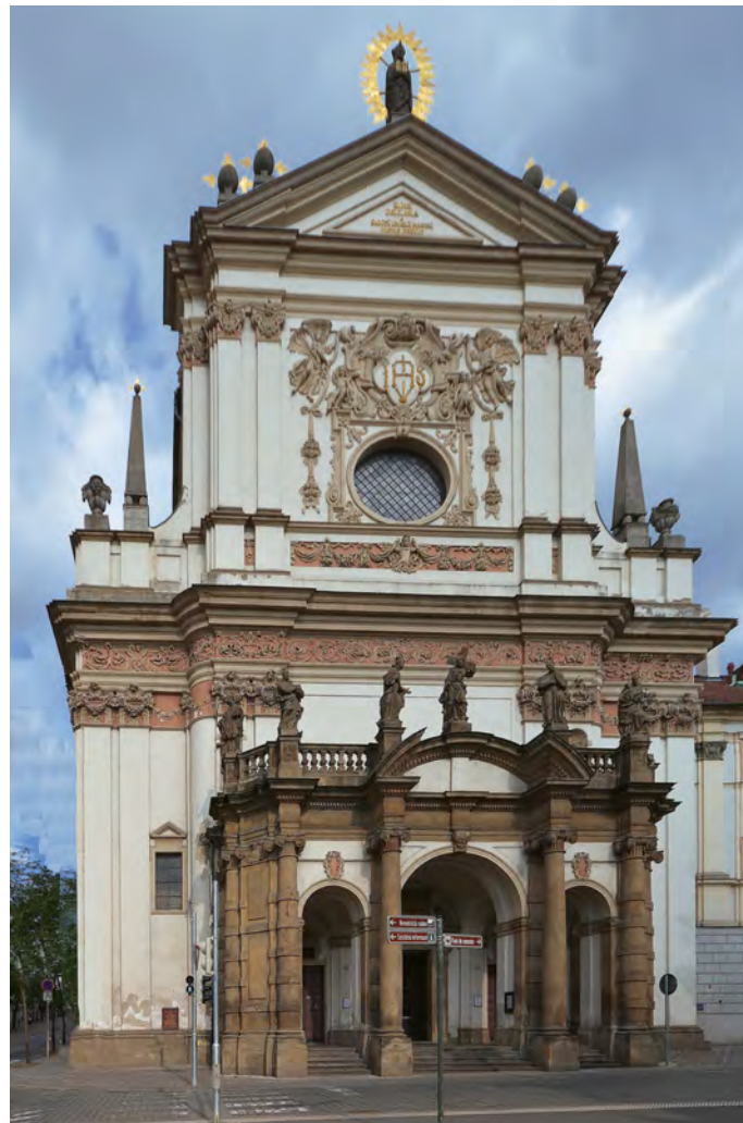
Projektem kostela sv. Ignáce z Loyoly na novoměstském Dobytém trhu (dnes Karlovo náměstí) uvádí Carlo Lurago do Prahy řadu pokročilých a zde nových slohových prvků

Barokní sloh se sice ve své rané podobě u nás projevil už v pobělohorském období (typicky na stavbách Albrechta z Valdštejna v Praze a Jičíně), teprve ve druhé polovině 17. století se však mohl plně rozvinout, aby na jeho sklonku dospěl k projevům reflektujícím vývojové směry a velká díla vrcholného baroka v Itálii. Centrem tohoto dění byla u nás samozřejmě Praha.