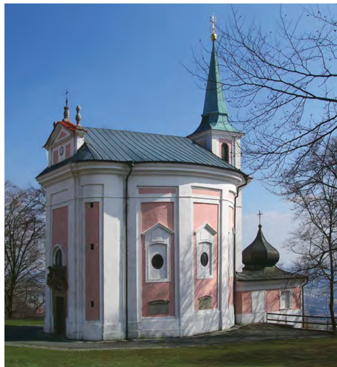
Mezi raná díla Kryštofa Dientzenhofera patří i kaple sv. Maří Magdalény na Skalce u Mníšku pod Brdy dokončená roku 1694

V Praze té doby byl sice dostatek stavebních zakázek, ale i velká konkurence a v ní architekti a stavitelé už tehdy slavní a žádaní. Kryštof Dientzenhofer se zatím mohl vykázat jen