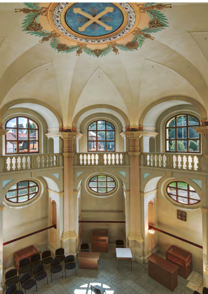
Součástí první velké zakázky Kryštofa Dientzenhofera pro tepelské premonstráty byla i špitální kaple Nejsvětější Trojice v Teplé, centrální stavba na půdorysu osmiúhelníku