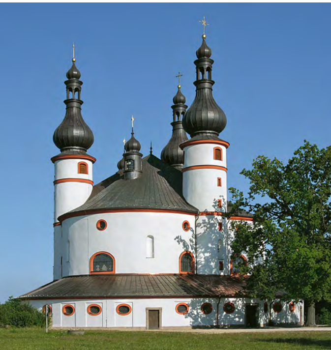
Dílem Geoga Dientzenhofera v rámci velké zakázky v bavorském Waldsassenu je i poutní kaple sv. Trojice. Připomeňme, že Georgovým polírem zde byl jeho mladší bratr Kryštof

1707 dokončil mladší bratr Johann. Z řady staveb v okolí připomeňme aspoň benediktinský klášter v Banzu a cisterciácký v Langheimu.