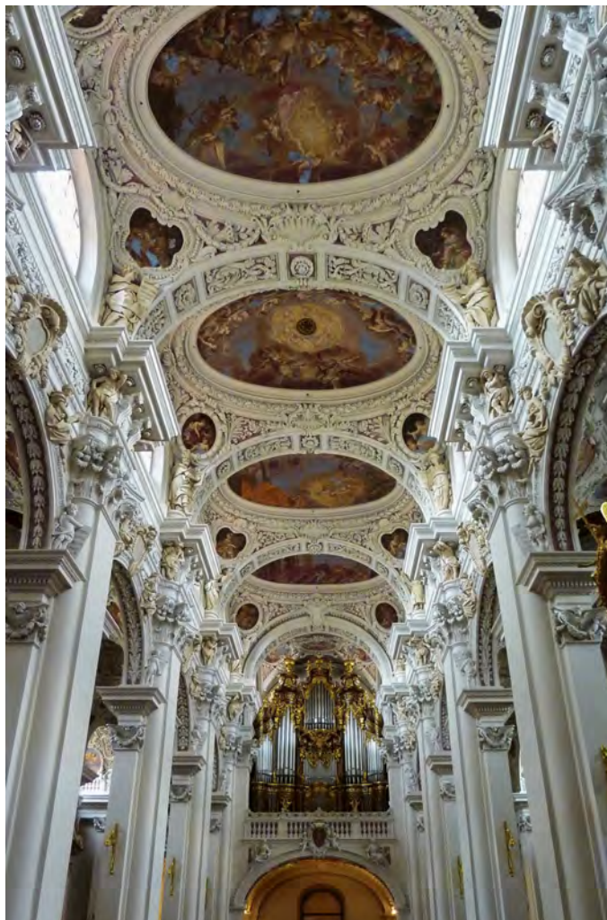
Velkolepá přestavba pasovské katedrály sv. Štěpána pod vedením Carla Luraga byla pro bratry Dientzenhoferovy dokonalou školou stavitelských řemesel, ale i počátkem cesty do Prahy, kde byl Carlo Lurago už proslulým stavitelem