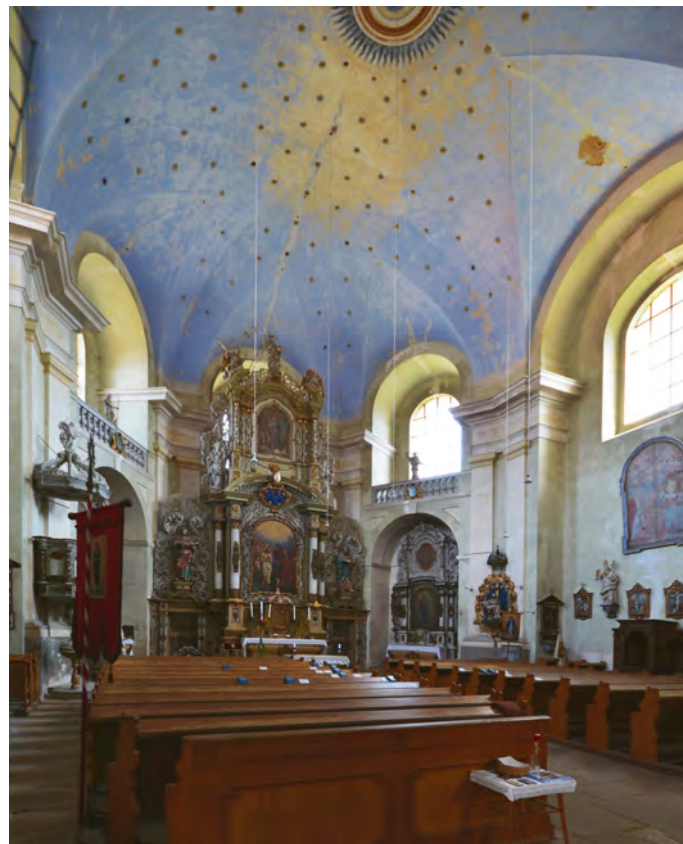
Další Kryštofovou stavbou pro tepelský klášter byl kostel Narození sv. Jana Křtitele v Úterý, založený na pozoruhodném půdorysu protáhlého osmiúhelníku vepsaného do oválu