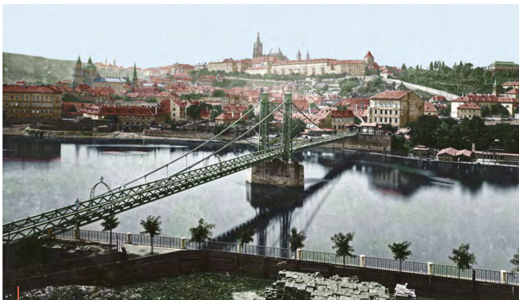
Železná neboli Rudolfova lávka spojovala vltavské břehy mezi Rudolfinem a Klárovem