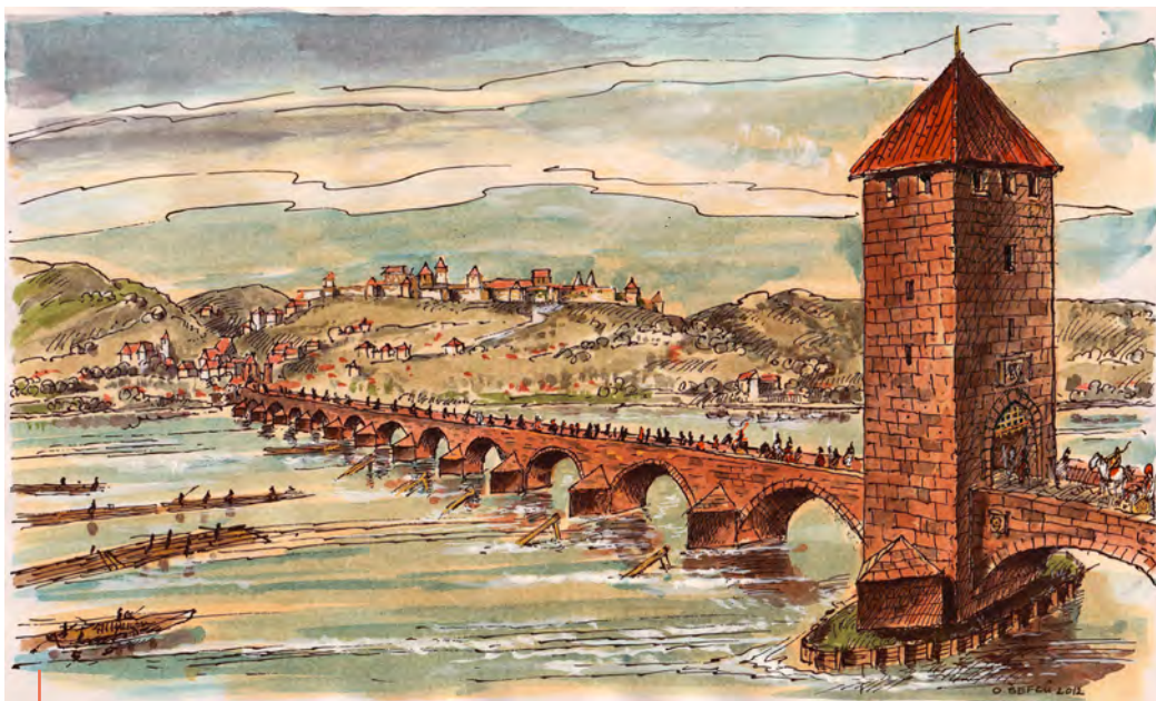
Kresba: Ondřej Šefců

svatováclavských zázraků. Tři roky po násilné smrti svatého Václava bylo jeho tělo převáženo ze Staré Boleslavi do Prahy. Když průvod s povozem s tělem knížete dorazil do Prahy, nemohl překonat rozbouřenou Vltavu. Divoká voda se valila přes povodňi prolomený dřevěný most. Po modlitbách se řeka zázračně uklidnila a nechala průvod se světcovým tělem překonat řeku. Legenda tak dokládá, že v Praze byl dřevěný most už v první polovině 10. století.