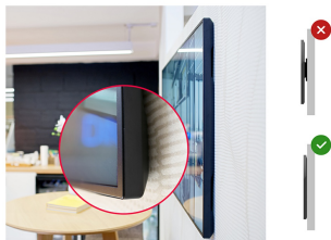
Zero-Gap Wall Mount

Designed to perform in continual, around the clock environments, the LH6570UHB can be installed and utilised in landscape and portrait orientation. The jaw dropping and best-in-class 35mm total depth (when used with the included proprietary brackets) will mean this display can be installed discreetly and elegantly in all areas.