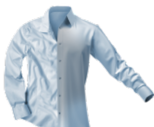
Ochrana proti zmačkání prádla