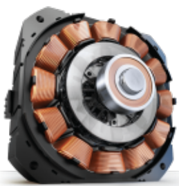
ProSmart™ invertorový motor